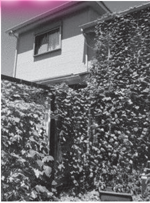
昨年度最優秀賞の緑のカーテン