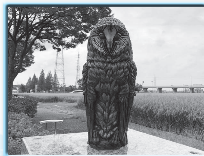
森正響一 「Nihil」 2019年制作 陶