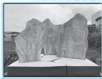
洞口明里 「スケッチ」 2019年制作 陶