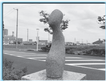
鈴木健士朗 「かわらぬもの」 2019年制作 花崗岩