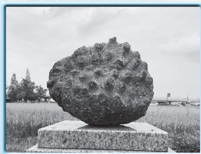
木方立樹 「Morphic Unit」 2017年制作 花崗岩