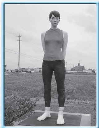
加藤萌恵 「在る人」 2019年制作 ジェスモナイト