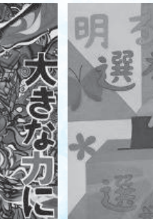
井上奈々 (知立南中 1年)