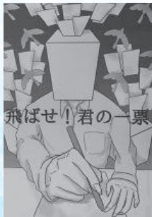
梅村有紀 (山本学園情報文化専門学校高等課程 3年)