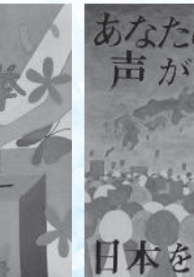
竹本智織 (竜北中 2年)