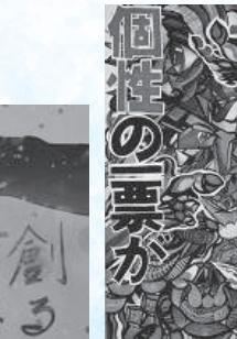
山本武蔵 (山本学園情報文化専門学校高等課程 2年)