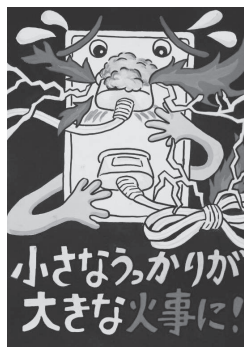
安城市立二本木小 6年 野々山結