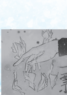
青山由樹 (山本学園情報文化専門学校高等課程 3年)