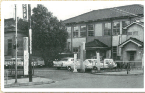
▲当時の知立市役所庁舎