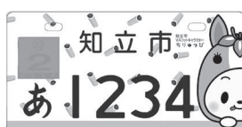
※色は排気量により異なります。

知立市制50周年を記念して原動機付自転車等のオリジナルナンバープレートを発行するにあたり、5月1日～29日の間でインターネット等で投票を行った結果、429票の投票があり、こちらのデザインに決定しました!