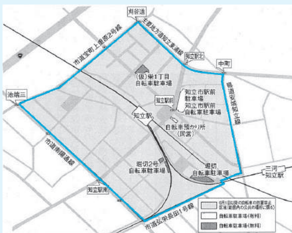
問 土木課 管理係 (☎95-0155)

また、通学や通勤の方法が変わったり、進学や転勤などで自転車等を長期間利用しなくなった場合に、自転車駐車場に放置しないようにしましょう。