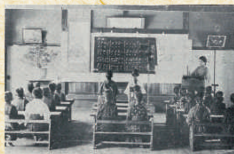
▲猿渡尋常小学校の唱歌の授業 (明治時代)

明治5年の学制の公布によって小学校が設立されて以降、学校制度の改革や市町村制の実施、町村の廃合などによって小学校の校名や学区がめまぐるしく変わりました。戦後においては小学校3校(知立・猿渡・来迎寺)、中学校1校(知立)で教育が行われていましたが、昭和40年代には知立団地の建設などにより、市内の人口が急増したため、相次いで小中学校が新設されました。 市制が施行された1970年には前述の学校に知立東小学校を加えた4小学校で授業が行われていました。 当時の小学生は現在のように学区が分かれていた訳ではなく、遠い人だと片道1時間近くかけて通学していた人も居たそうです。 ちなみに、今年で市が市制50周年を迎えますが、市と同様に今年で50年を迎える学校施設は、知立東小学校の「希望の像」な「かよしよう」や「プール、猿渡小学校のプール」などです。