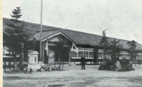
▲知立尋常小学校 (昭和13年『知立小学校百年誌』より)