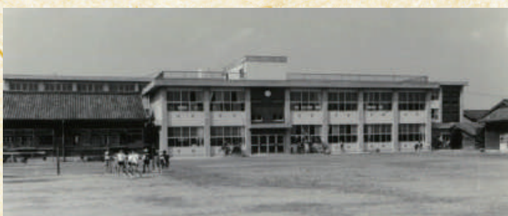
▲知立小学校 (市制施行当時)