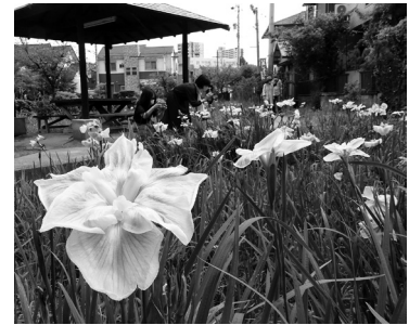
▲推薦作品 「ひときわ華やか」

なお、入賞作品は7月31日(土)～8月12日(木)に中央公民館1階北口壁面、8月14日(土)～22日(日)に観光交流センターで展示しますので、ぜひご覧ください。