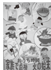
▲白名優豪さんの作品