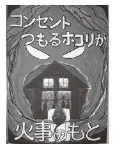
▲岩瀬聖さんの作品