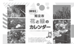
◀ 昨年のカレンダー(見本)

※「花と緑の写真」を引き続き募集しています。詳細は市ホームページをご覧ください。都市計画課へお問合せください。