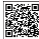
▲ノババックスワクチンの接種について