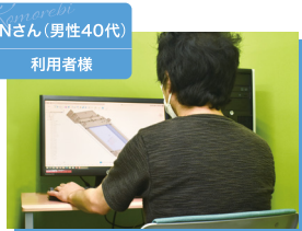
Nさん(男性40代) 利用者様