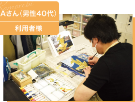
Aさん(男性40代) 利用者様