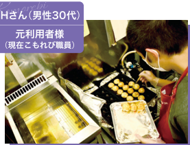
Hさん(男性30代) 元利用者様 (現在こもれび職員)