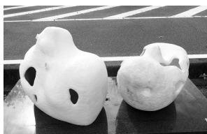
▲木原大貴 「大地への恵み」 2021年制作 陶