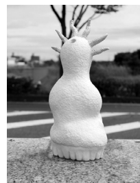
◀今川理恵 「ただ おぞらを みつめている」 2022年制作 陶