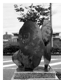
◀古賀利城 「けしきと どうぶつ」 2022年制作 鉄