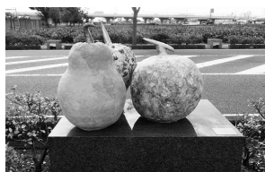
▲松岡真矢 「こころがら」 2022年制作 陶