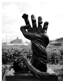
◀松木大悟 「腕」 2022年制作 F.R.P