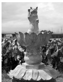
◀杉山青緋 「大吉」 2022年制作 F.R.P