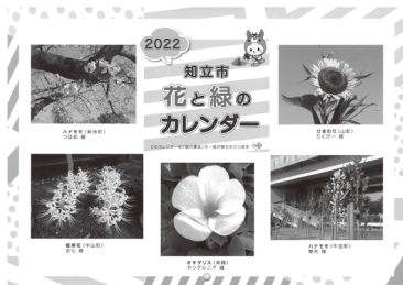
▲昨年のカレンダー (見本)

※「花と緑の写真」を引き続き募集しています。詳細は市ホームページをご覧ください。どうか、都市計画課へお問合せください。