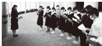
○文化芸術新人賞 ヤング・パティオウエーブ

問 文化協会事務局(文化会館内) ☎ 83-0151 火～金曜日の午前 10時～午後4時)