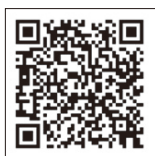
▲法務省ホームページ