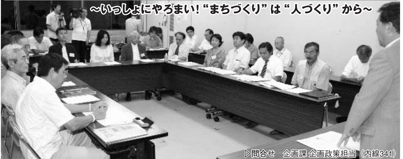
▶問合せ 企画課 企画政策担当 (内線341)

【参考】平成17年度は、17人の市民委員により、毎月2回程度の委員会を開催しました。主に、『子どもたちの安全』をテーマに議論を進め、今後、市長へ提言していきます。委員会の活動については、市公式ホームページにも掲載していますので、ご覧ください。