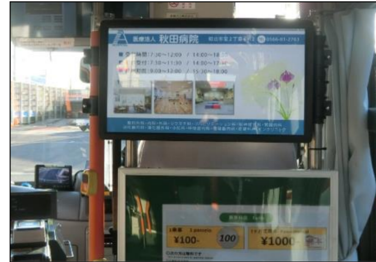
【令和7年度 デジタルサイネージ行政情報 掲載実績】 令和8年2月現在