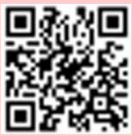
バスロケーションシステム