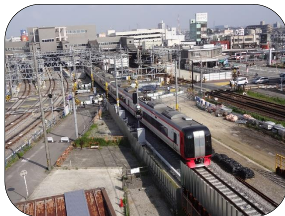
切替後の知立駅の様子

平成28年4月23日始発列車から知立駅の4番線（三河線）及び5番線（名古屋本線名古屋方）が仮線へと切替りました。今後は、6番線（名古屋本線豊橋方）を仮線へと切り替え、その後、本体工事を施工していきます。