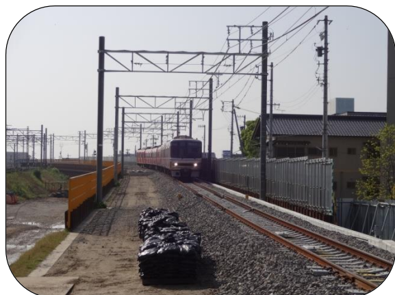
知立駅東側から名古屋本線（名古屋方）の仮線の様子