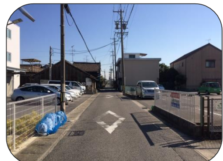
知立環状線及び三知緑道線予定地

三河知立駅の移設に伴い、知立環状線(県決定)の一部幅員を23mへ変更しました。また、三知緑道線(市決定)を追加し、沿線環境の保全と安全で快適な歩行者・自転車空間を確保します。