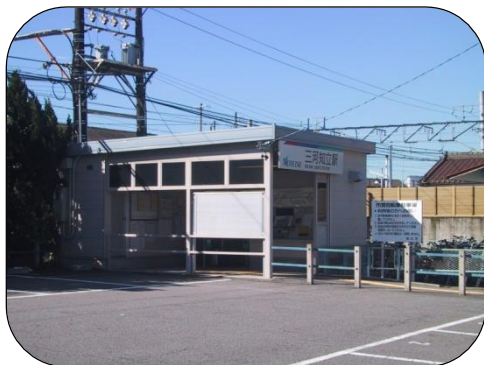
現在の三河知立駅