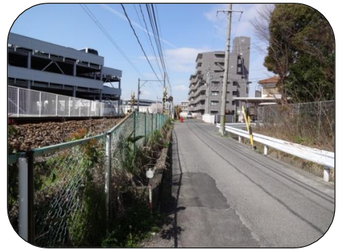
移設先付近の現況(竜北中学校南側)

三河知立駅の位置を現在の位置から豊田方面へ約900mの竜北中学校付近に変更しました。それに伴い一部区域も変更しました。