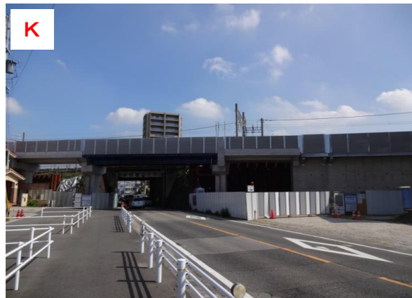
仮高架橋（県道安城知立線交差部）