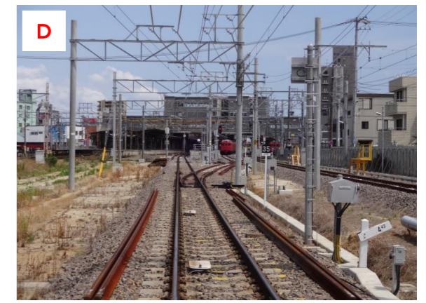
仮線と留置線（知立2号踏切より）