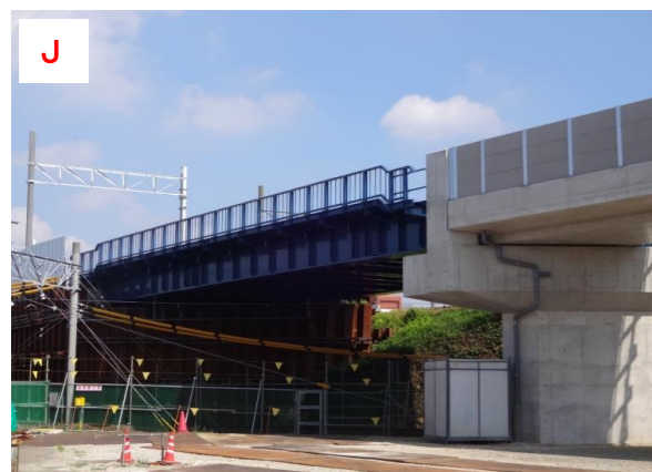
仮高架橋（三河線交差部）