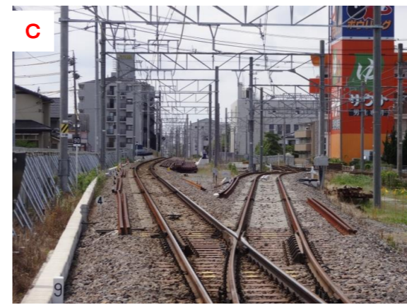
知立2号踏切より仮線を望む