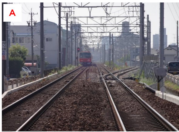
名古屋本線からの仮線への分岐（名古屋方面より）