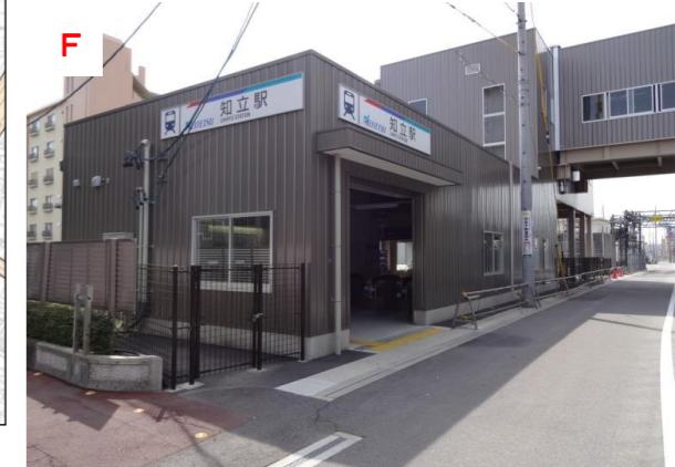
知立駅南改札口（平成27年2月開設）