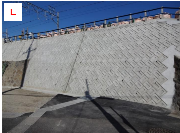
仮線擁壁（名古屋本線名古屋方面分岐地点）