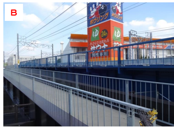
仮架道橋と仮歩道橋（国道155号交差部）