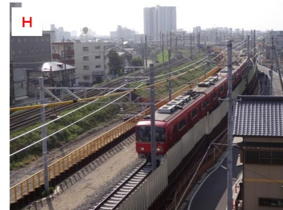
名古屋本線と仮線