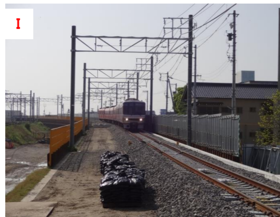
名古屋本線（名古屋方）仮線