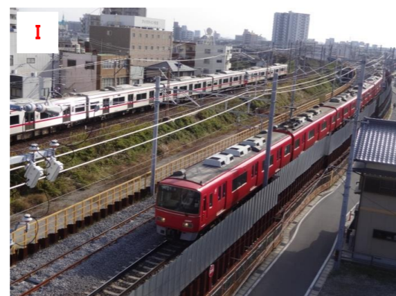
I 名古屋本線と仮線