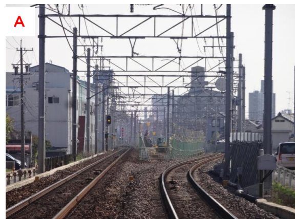
A 名古屋本線からの仮線への分岐（名古屋方面より）