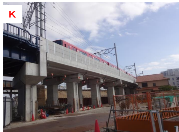
K 仮高架橋（三河線交差部付近）