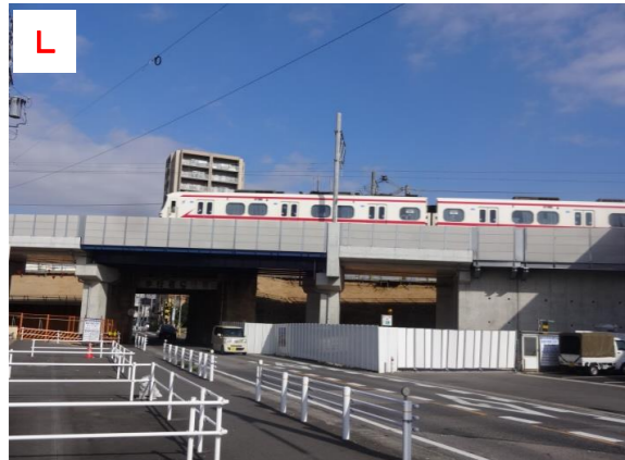
L 仮高架橋（県道安城知立線交差部）