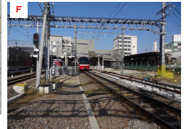
F 仮4・5番線ホーム、仮6番ホーム（施工中）と現6番ホーム