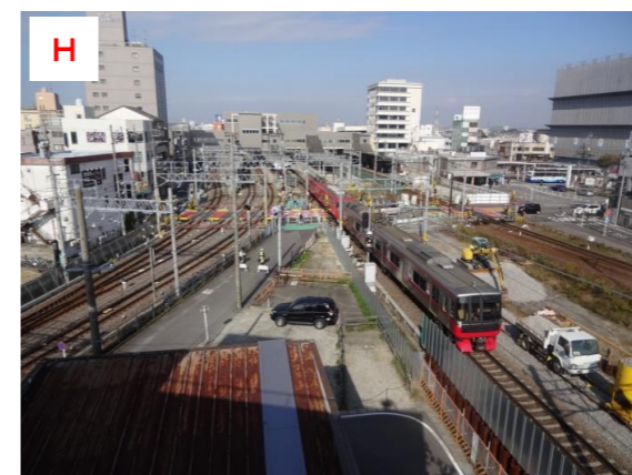
H 知立駅全景（仮跨線橋及び仮線切替状況）