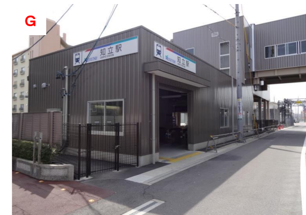
G 知立駅南改札口（平成27年2月開設）