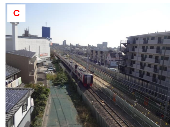
C 福祉体育館より知立駅方面を望む