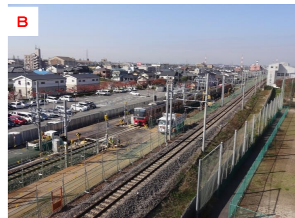
B 福祉体育館より工事用踏切を望む（本体工事施工中）