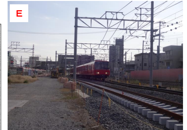
E 知立2号踏切より知立駅を望む