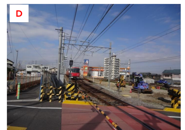
D 知立2号踏切付近より仮線を望む