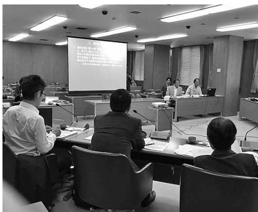
大和市議会視察〈第1委員会室〉

パワーポイントにより、知立市議会基本条例の趣旨、制定に至った経緯や、議会報告会の実施、自由討議、議決権の拡大、政策討論会開催などに加え、予算・決算委員会、議会BCP、政務活動費に関する説明並びに意見交換を行いました。