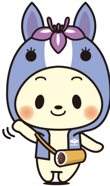
知立市マスコットキャラクター ちいゅっぴ