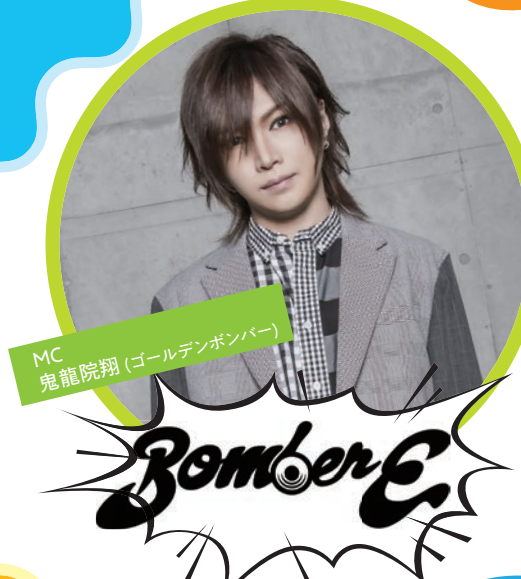
MC 鬼龍院翔 (ゴールデンボンバー)