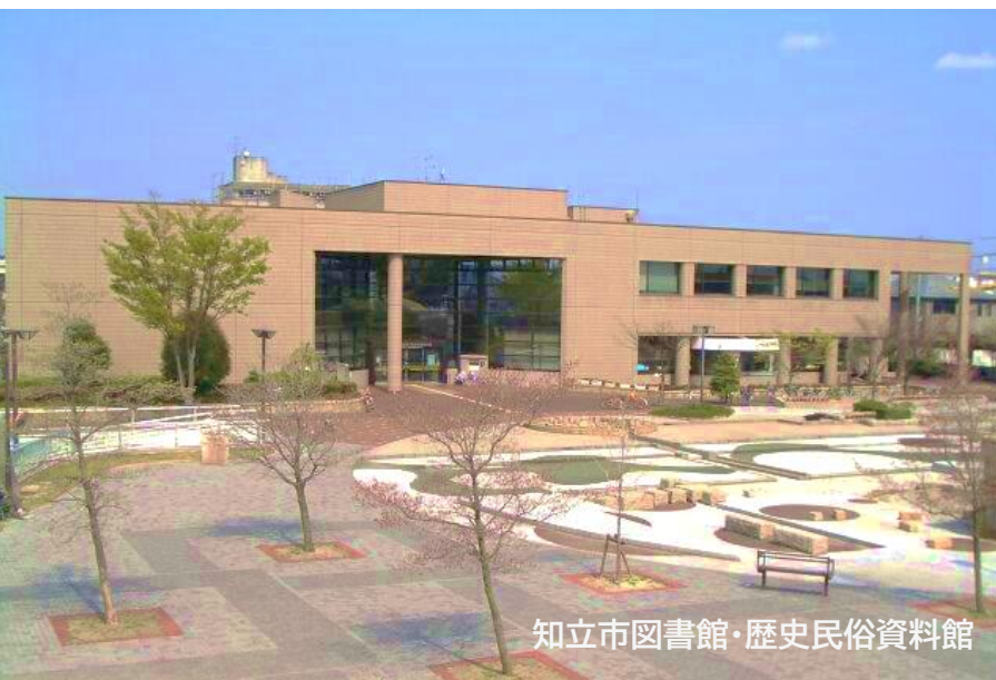
知立市図書館・歴史民俗資料館