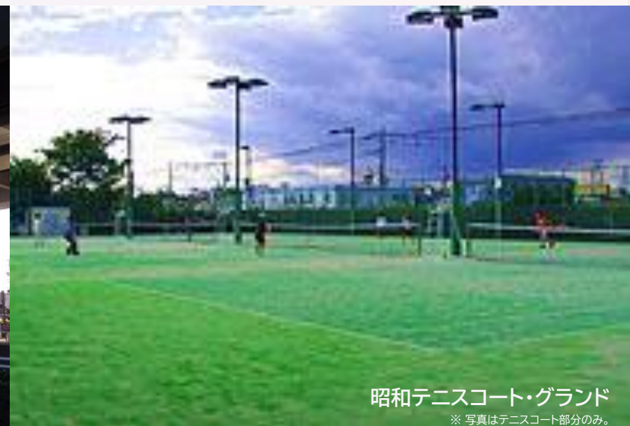
昭和テニスコート・グラウンド