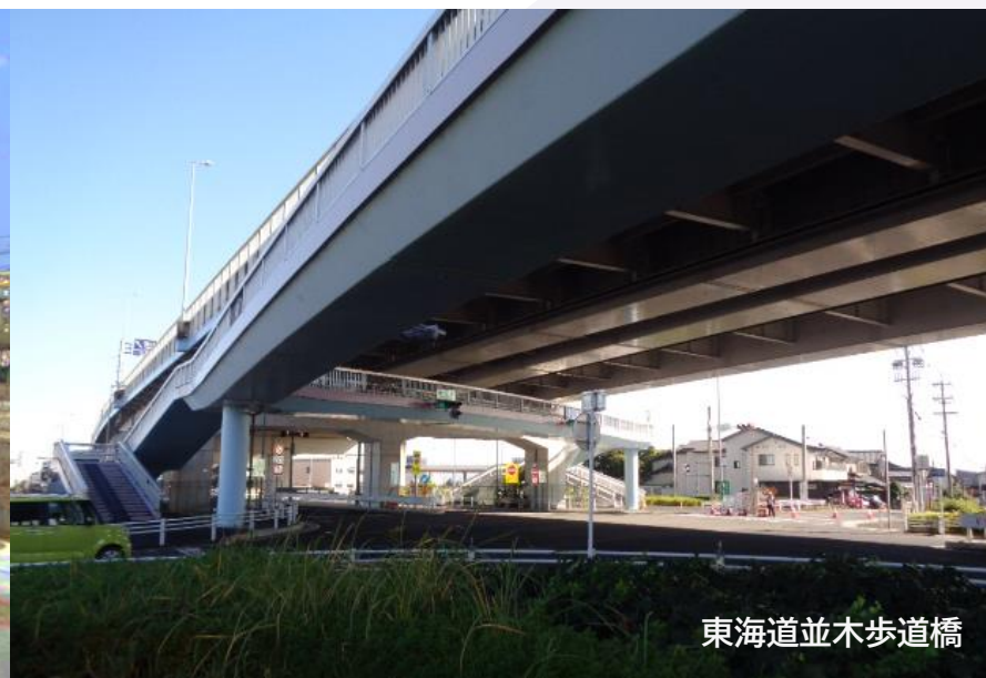
東海道並木歩道橋