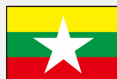
မြန်မာဘာသာ (ミャンマー語)

ภาษาที่มีให้บริการภายในเวลา 10:00 – 17:15