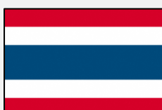
ภาษาไทย (タイ語)

ภาษาที่มีให้บริการภายในเวลา 9:00 – 17:15