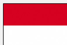
Bahasa Indonesia (インドネシア語)