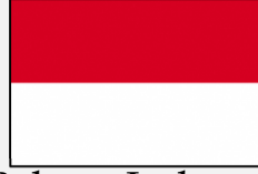
Bahasa Indonesia (इन्डोनेशिए-ए)