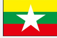
မြန်မာဘာသာ (मिअनमर-ए)