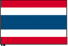
ไทย ล่าม (タイ語)