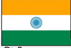
हिंदी अनुवाद (हिन्दी-ए-ए)