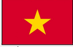
Tiếng Việt (ベトナム語)