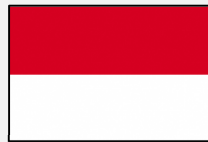
Bahasa Indonesia (インドネシア語)