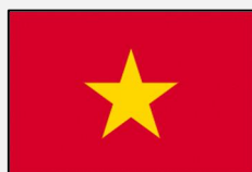
Tiếng Việt (バトナム語)