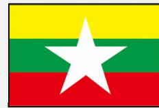
မြန်မာဘာသာ (ミャンマー語)