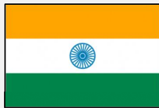
हिंदी अनुवाद (ヒンディー語)